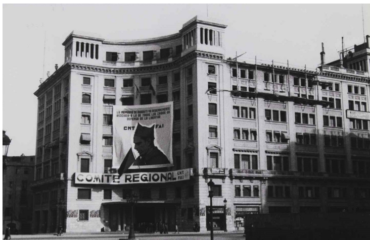
CASA CNT-FAI EN VÍA DURRUTI