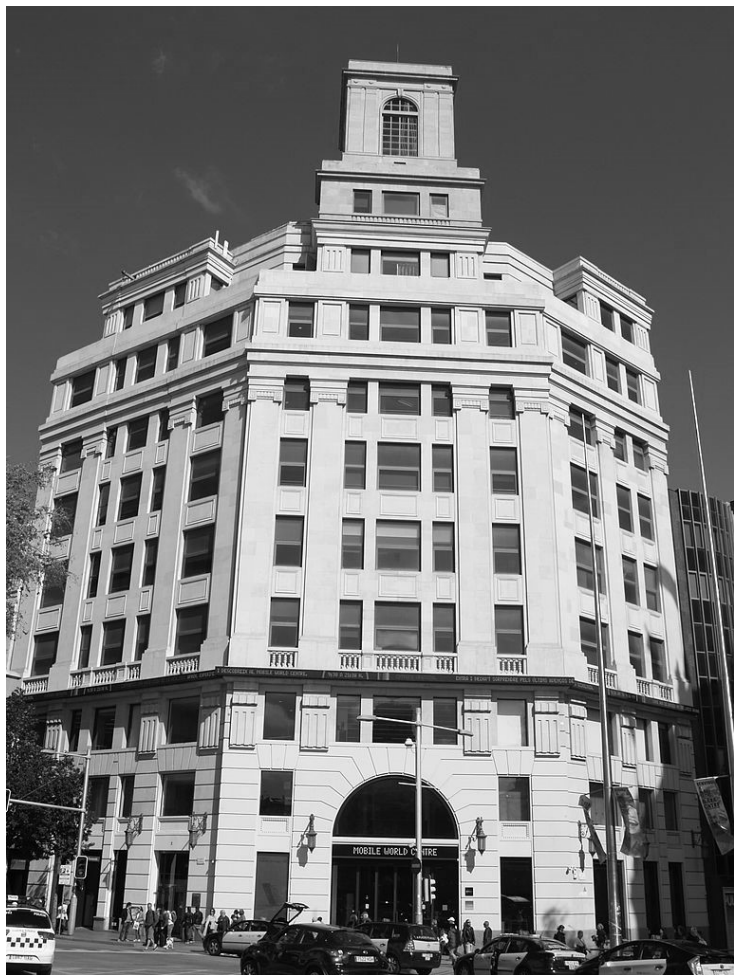
EDIFICIO DE LA TELEFÓNICA, DONDE SE INICIARON LOS ENFRENTAMIENTOS CALLEJEROS (FOTO ACTUAL)