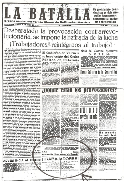
REPRODUCCIÓN DE LA OCTAVILLA DE LAD EN LA BATALLA. ÓRGANO DEL POUM

OCTAVILLA DE LAD DISTRIBUIDA EL 5 DE MAYO DE 1937 EN LAS BARRICADAS