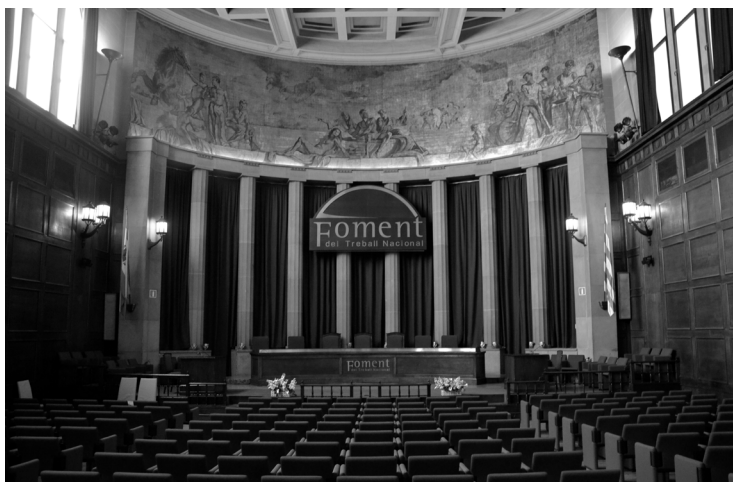
SALÓN ROJO DE LA CASA CNT-FAI. FUE EL LUGAR DONDE EL 21 DE JULIO DE 1936 SE VOTÓ A FAVOR DEL COLABORACIONISMO. AL FONDO, ARRIBA, PINTURAS DE SERT. ACTUAL SEDE DE LA PATRONAL CATALANA