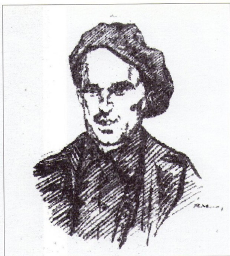
DIBUJO A LÁPIZ DE PABLO RUIZ, FUNDADOR DE LAD