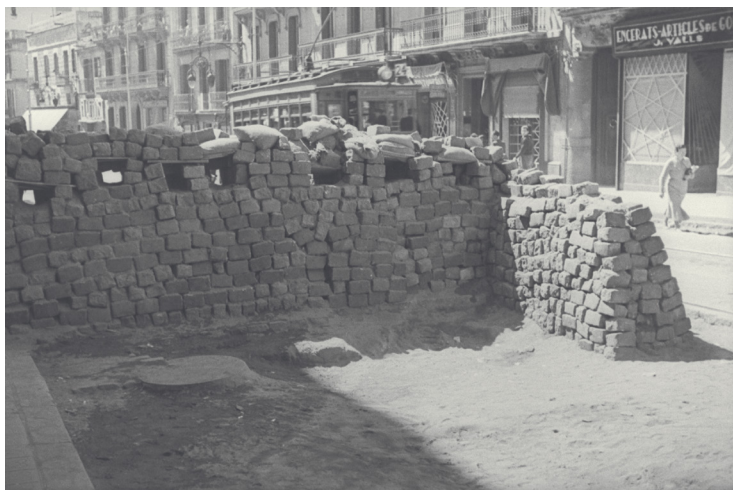
BARRICADA EN BARCELONA, BARRIO DE GRACIA