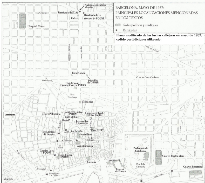
PLANO DE LAS LUCHAS CALLEJERAS DE BARCELONA EN MAYO DE 1937