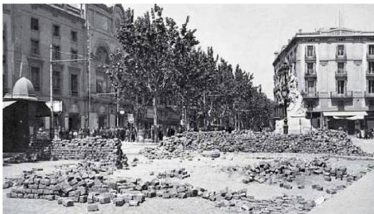
BARRICADA EN PLAZA DEL TEATRO