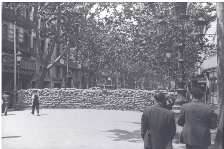
BARRICADA MAYO DE 1937 EN LAS RAMBLAS