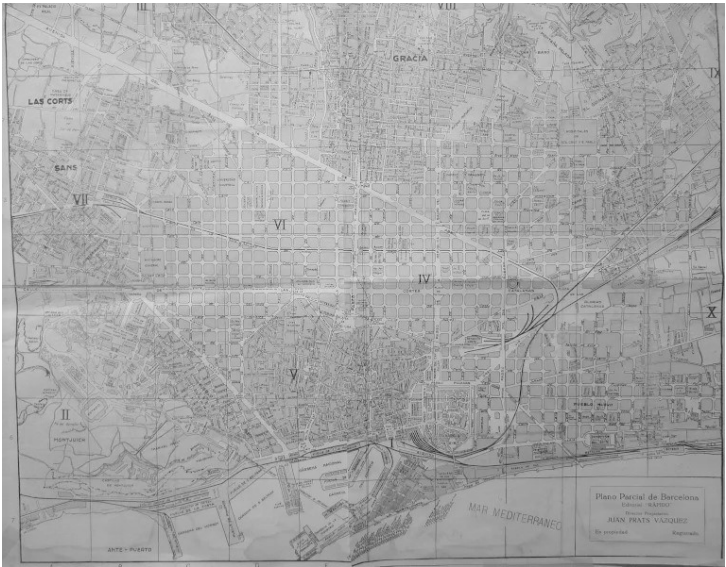
PLANO DE BARCELONA EN 1936