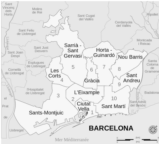
DISTRITOS ACTUALES DE BARCELONA