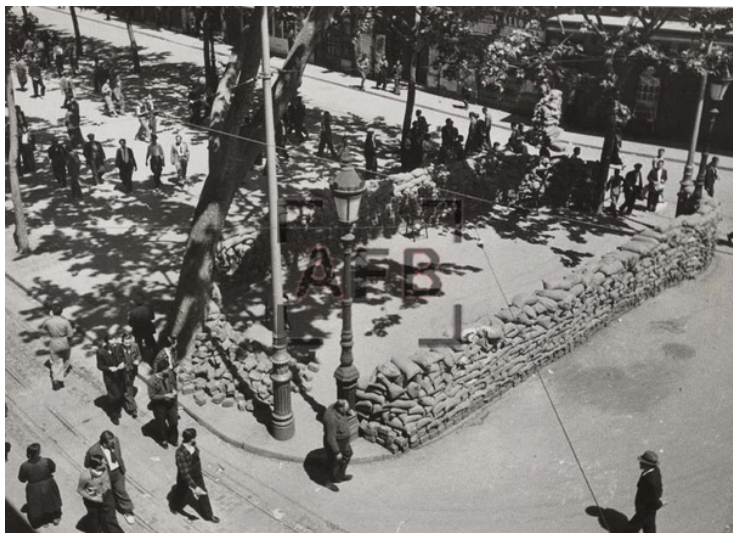
BARRICADA DE LAD EN RAMBLAS-CALLE UNIÓN