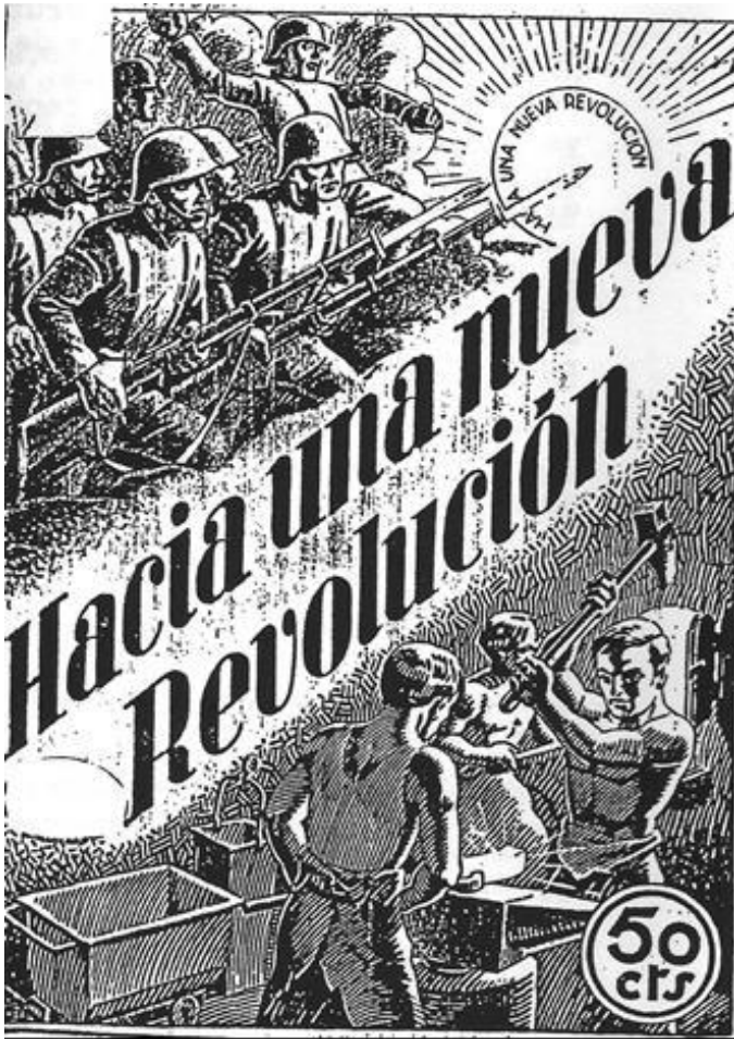
Portada del folleto Hacia Una Nueva Revolución redactado hacia octubre/noviembre de 1937 y publicado probablemente en enero de 1938, puesto que en el número 12 de El Amigo del Pueblo , fechado el 1 de febrero de 1938,